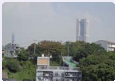
保健室からの風景